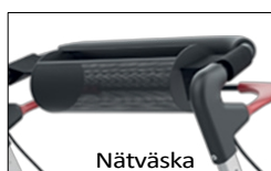
Tillbehörsväska för redskap som läkemedel och kosmetika