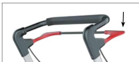
Styrstång för säkerhetsbroms med brett handtag