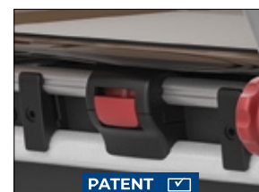
Innovativ "Click & Safe"-spärr